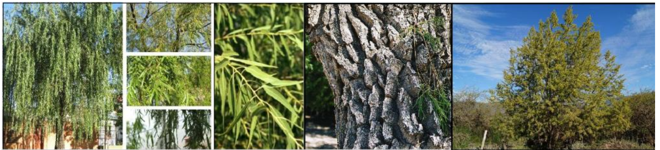
Salix Humboldtiana (sauce criollo)

A continuación se listan de manera ilustrativa el catálogo de especies a implantar: