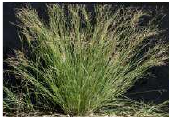
Foto: Panicum Urvilleanum .