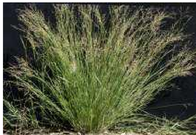
Foto: Panicum Urvilleanum .