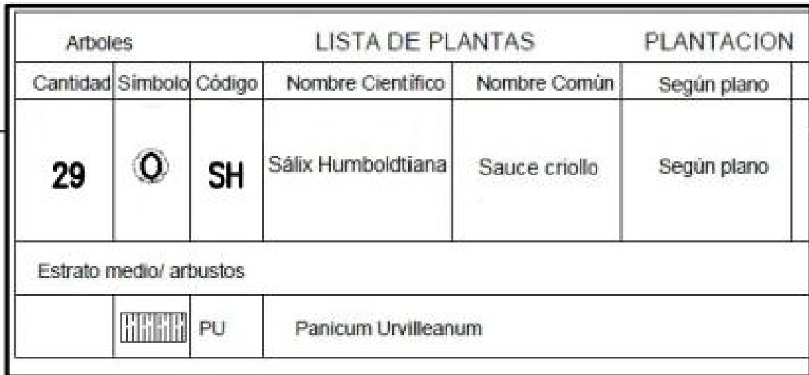
Tabla: Cantidad de especies nativas a implantar.

A continuación se listan de manera ilustrativa el catálogo de especies a implantar: