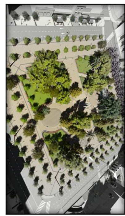
PROYECTO + ENTORNO ACTUAL - ESC. 1 : 500