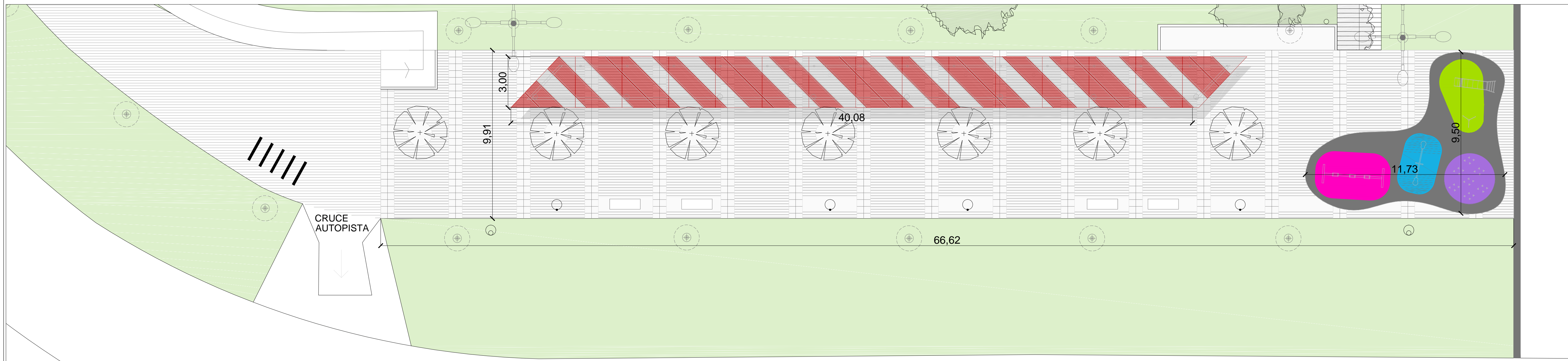
PLANTA DETALLE SECTOR PASEO DE ARTESANOS esc.:1.125